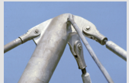
➔ Abb. 3: Gabelköpfe und Haltesysteme sind zumeist aus feuerverzinktem Gussstahl.

Gussteile werden seit langem durch Feuerverzinken dauerhaft vor Korrosion geschützt. Typische Einsatzgebiete für Stahlguss sind der Schiffsbau, die Automobilindustrie, der Maschinenbau und der Anlagenbau. Im Bauwesen werden vielfach Gussteile in Form von Gabelköpfen, Haltesystemen und Knotenpunkten an Seilnetz- und Raumdachwerken verwendet. Sollen Bauteile aus Stahlguss oder Gusseisen verzinkt werden, sind besondere verzinkungstechnische Maßnahmen vorzusehen. Die Beizbehandlung dieser Bauteile bedingt besondere Arbeitsgänge, die eine Abstimmung mit dem Verzinkungsbetrieb erforderlich macht. Qualitätseinbußen beim Feuerverzinken von Gussteilen sind meist auf die Oberflächenbeschaffenheit des Werkstückes zurückzuführen. Die auftretenden Schwierigkeiten (Abb. 4) beruhen häufig auf eingebranntem Formsand, Oxiden aus einer Glühbehandlung, Graphitresten, Verunreinigungen oder Oberflächenfehlern (z.B. Lunkern). Einer gründlichen Oberflächenvorbereitung im Fertigungsbetrieb kommt somit eine besondere Bedeutung zu.