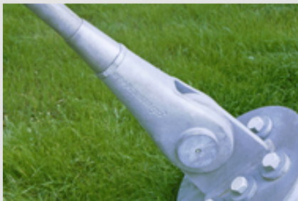
➔ Abb. 1: Gussteile werden seit langem feuerverzinkt ausgeführt.