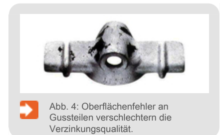
➔ Abb. 4: Oberflächenfehler an Gussteilen verschlechtern die Verzinkungsqualität.

Gussteile werden seit langem durch Feuerverzinken dauerhaft vor Korrosion geschützt. Typische Einsatzgebiete für Stahlguss sind der Schiffsbau, die Automobilindustrie, der Maschinenbau und der Anlagenbau. Im Bauwesen werden vielfach Gussteile in Form von Gabelköpfen, Haltesystemen und Knotenpunkten an Seilnetz- und Raumdachwerken verwendet. Sollen Bauteile aus Stahlguss oder Gusseisen verzinkt werden, sind besondere verzinkungstechnische Maßnahmen vorzusehen. Die Beizbehandlung dieser Bauteile bedingt besondere Arbeitsgänge, die eine Abstimmung mit dem Verzinkungsbetrieb erforderlich macht. Qualitätseinbußen beim Feuerverzinken von Gussteilen sind meist auf die Oberflächenbeschaffenheit des Werkstückes zurückzuführen. Die auftretenden Schwierigkeiten (Abb. 4) beruhen häufig auf eingebranntem Formsand, Oxiden aus einer Glühbehandlung, Graphitresten, Verunreinigungen oder Oberflächenfehlern (z.B. Lunkern). Einer gründlichen Oberflächenvorbereitung im Fertigungsbetrieb kommt somit eine besondere Bedeutung zu.